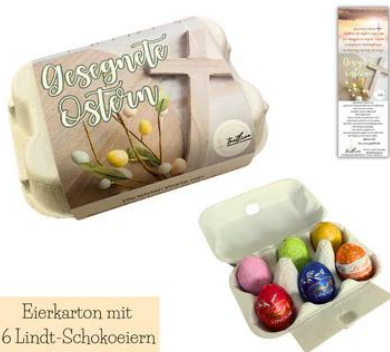
Eierkarton mit 6 Lindt-Schokoeiern und Textband

Wir sind immer wieder am Überlegen, mit welchen neuen Produkten wir die Botschaft weitergeben könnten und welche Produkte wir in unserem Shop-Sortiment aufnehmen wollen. Dazu nehmen wir gerne Ideen von euch entgegen.